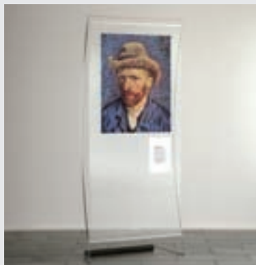
STAND BY® mag.floor